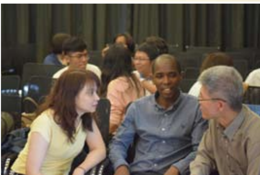
走進綠地團契，不同族群的弟兄姊妹相聚在愛裡