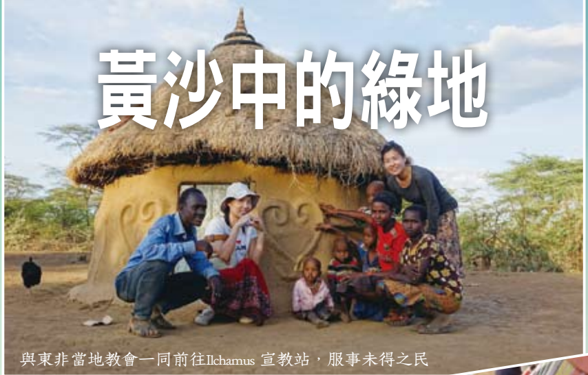
與東非當地教會一同前往Ilchamus 宣教站，服事未得之民