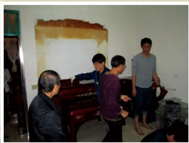
大家同心撤下神桌，預備迎接真光！

約翰福音第一章第五節提到：「光照在黑暗裡，黑暗卻不接受光。」我們獻上感謝，這世界的光在橋頭運行。